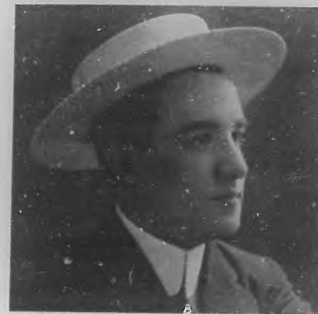
Conrado W. Massaguer. Notable caricaturista.