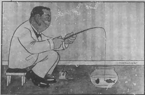
General José Miguel Gómez Presidente de la República.

Un Bagaria, un Blanco, un Massaguer cultivan un género especial dentro del arte: la caricatura.