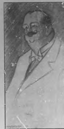
Gral. Ernesto Astert Gobernador