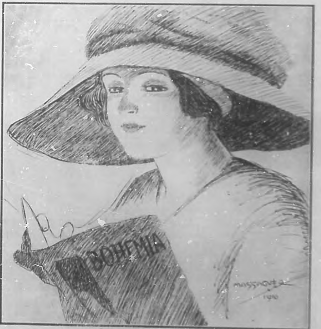
Una lectora de "Bohemia"