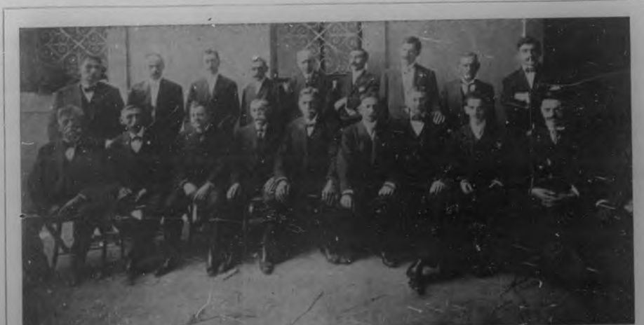
DIRECTIVA DE LA COLONIA ESPAÑOLA DE GUANAJAY