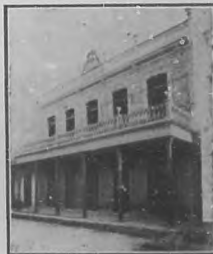
Guanajuay.—Edificio del Casino Español solemnemente inaugurado el día 29 del corriente mes.

Tuvo lugar el domingo pasado uno de esos actos á que nos tiene acostumbrados la colonia española diseminada por la isla, y que se repiten con frecuencia que habla bien alto en honor de los españoles, cuyas iniciativas, constancia y empuje debieran estimularnos, y bien alto en honor de nuestro generoso suelo que hace que tales iniciativas se desarrollen.