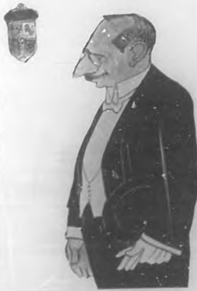
Sr. Pablo Soler y Guardiola Ministro de España.

Sean para él los plácemes de BOHEMIA que celebra sinceramente el éxito obtenido por el artista, y amigo estimado. Recíbalos, muy efusivos.