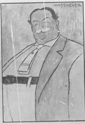
Mr. Taft Presidente de los Estados Unidos.